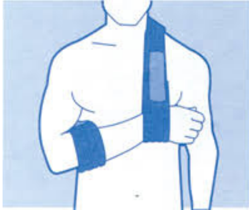
Figuur 3: juiste positie van arm in collar 'n cuff