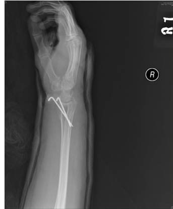
Figuur 3: fixatie met pinnen