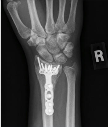
Figuur 2: fixatie met plaat en schroeven